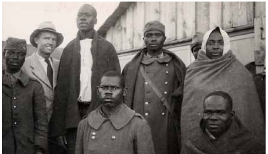
16 – Soldat français du Stalag IX A.